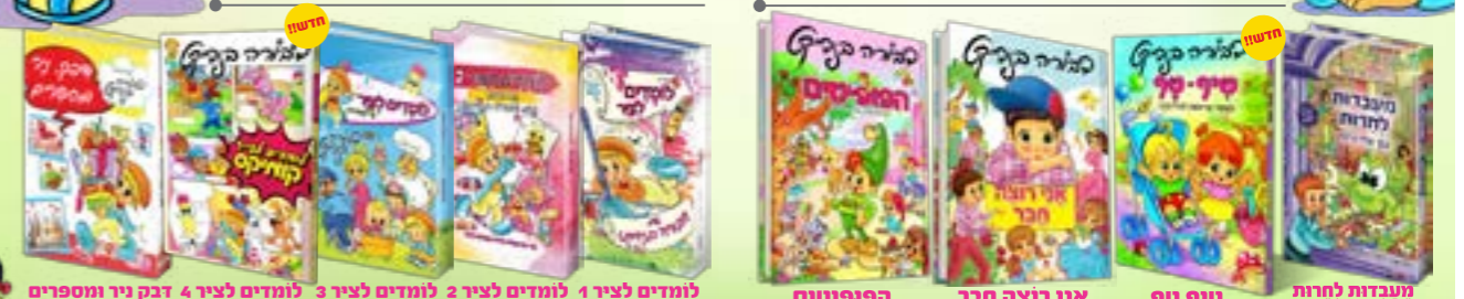
לומדים לצייר 1 לומדים לצייר 2 לומדים לצייר 3 לומדים לצייר 4 דבק ניר ומספרים יוצרים קומיקס קרקטורות ונס לצבע מעבודות לחרות עם אלי וות - תודה של סוס סיף טף ספר תורה לילדים לקטנות כולל קרי אני רוצה חבר הספר עילוי כל ילד וילדה יביר הרפתקאות באי הבדואות לומדים להכיר ולתמודד נכון בסדרה על חוקי נהיה ויהיה חיים רוי הפופיטים הרפתקאות באי הבדואות ספר שילוב כל ילד וילדה יביר לומדים להכיר ולתמודד נכון בסדרה על חוקי נהיה ויהיה חיים רוי

ניתן להשיג ברשת חנויות: "אור החיים", "יפה נוף", "סטימצקי", "צומת ספרים" ובחנויות הספרים המוכרות או בטל: 052-4033344 | הפצה: קולמוס